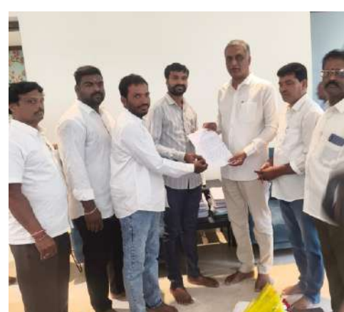
ప్రయోజనం లేకుండా పోయిందని మండిపడ్డారు. అధికారులు మారుతున్నా లబ్ధిదారుల సమస్యలు మాత్రం అక్కడే వేలాడుతున్నాయని ఆవేదన వ్యక్తం చేశారు. కనీసం తమ సమస్యలను అధికారులకు విన్నవించుకుంటామని కార్యాలయాలకు వెళ్లితే, అక్కడి సిబ్బంది లబ్ధిదారులను