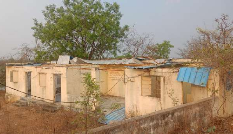
లేకపోవడంతో ప్రజలు పాత పద్ధతులనే పాటిస్తున్నారు. వైకుంఠధామాల్లో నీటి సరఫరా, విద్యుత్ కనెక్షన్లు లేవు. పారిశుధ్యం లేకపోవడం, మొక్కలు పెరగడం, రేకులు, గోడలు కూలిపోవడం, అధికారుల గ్రామ పంచాయతీల పర్యవేక్షణ వల్ల నిరుపయోగంగా వైకుంఠధామాల మారాయని ప్రజలు ఆవేదన వ్యక్తం చేస్తున్నారు. ఇప్పటికైనా అధికారులు గ్రామపంచాయతీ పాలకవర్గం స్పందించి వైకుంఠధామాల ఉపయోగంలోకి తీసుకురావాలనే మండల ప్రజలు కోరుతున్నారు.

కూలిపోయే స్థితిలో ఉన్నాయి. స్నానం చేసే సౌకర్యం లేదు మృతదేహాలను ఉంచడానికి తగిన ప్రదేశం లేక ప్రజలు తీవ్ర ఆవేదనలో ఉన్నారు. సృశాన వాటికను పట్టించుకునే నాధుడే లేదని గ్రామస్థులు వాపోతున్నారు ఈ సృశానానికి వెళ్లే ప్రజలు కార్యక్రమం అనంతరం స్నానం చేయాలన్న నిమిషం కూర్చుంటున్న దుస్థితి ఏర్పడుతుంది. గ్రామంలో ప్రధానంగా ఉన్న సమస్యలపై అధికారుల దృష్టి పడకపోవడం ప్రజలను బాధ కలిగిస్తుంది.