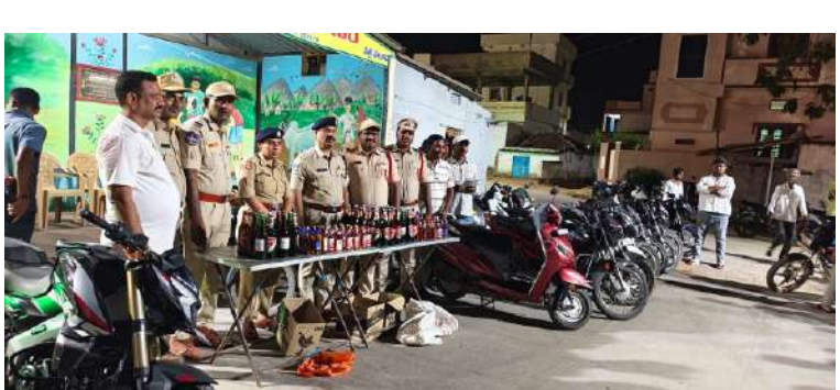
కార్టన్, కటాఫ్ పార్టీలు మరియు హార్డింగ్ డీమ్లను ప్రత్యేకంగా రంగంలోకి దించారు. తనిఖీల్లో స్వాధీనం చేసుకున్న వివరాలు: సరైన పాత్రలు లేని 20 బైకులు, వాహనాలను, బెల్ట్ షాపుల్లో అక్రమంగా నిల్వ ఉంచిన 46 లీటర్ల మద్యాన్ని పోలీసులు స్వాధీనం చేసుకుని, సంబంధిత వ్యక్తులపై గంజాయి, డ్రగ్స్ వంటి వ్యసనాలకు