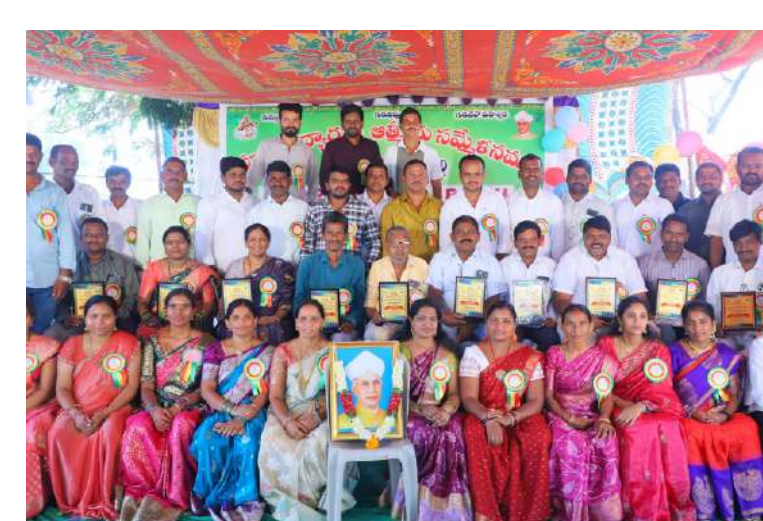
నేటి తరం -జనగాం జిల్లా రఘునాథపల్లి మండలం పరిధిలోని వెల్లి గ్రామ జిల్లా పరిషత్ ఉన్నత పాఠశాల జెడ్పీఎస్ఎస్ ఆవరణలో పూర్వ విద్యార్థుల ఆత్మీయ సమ్మేళనం అత్యంత వైభవంగా జరిగింది. దాదాపు 22 సంవత్సరాల సుదీర్ఘ విరామం తర్వాత ఒకే బ్యాచ్ కు చెందిన పూర్వ విద్యార్థులంతా ఒకే చోటికి చేరడంతో పాఠశాల ప్రాంగణంలో పండుగ వాతావరణం నెలకొంది.