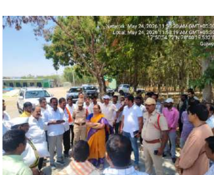
తో పాటు మక్కలు కూడా కొనుగోలు చేస్తున్నామని తెలిపారు. మక్కలు, పరి ఒకే సారి రావడం వలన హమాల్, లారీల కొరత ఏర్పడిందని ఈ సమస్యలు అధిగమించడానికి బయట రాష్ట్రాల నుండి హమాల్ కాకుండా స్థానిక గ్రామాల్లో హమాల్ లను సెంటర్ లలో ఉంచాం, లారీల కొరత తీర్చడానికి కలెక్టరేట్ లో కంట్రోల్ రూమ్ ఏర్పాటు చేసి, ఎక్కువ ధాన్యం ఉన్న సెంటర్ లకు ప్రాధాన్యత కల్పిస్తూ గత కొన్ని రోజులుగా కొనుగోలు సజావుగా జరిగిందని అధికార యంత్రాంగం పని చేస్తుందని తెలిపారు. ధాన్యం నిలవచేయడానికి స్థల కొరత వలన ఏ ఏం సి లో గోదాం మరియు షెడ్ లను ఉపయోగించి అందులో ధాన్యాన్ని దిగుమతి చేస్తున్నామని తెలిపారు. గోదాంలో దిగుమతి వలన ట్రాన్స్పోర్ట్, ధాన్యాన్ని వెంటనే లిఫ్ట్ చేస్తున్నామని తెలిపారు. ప్రభుత్వం రైతులు పండించిన వంట బివరి గింజ వరకు కొనుగోలు చేస్తుందని, కొనుగోలులో వేగం పెంచడంలో అధికార యంత్రాంగానికి సహకరించాలని జిల్లా రైతాంగానికి విజ్ఞప్తి చేశారు.