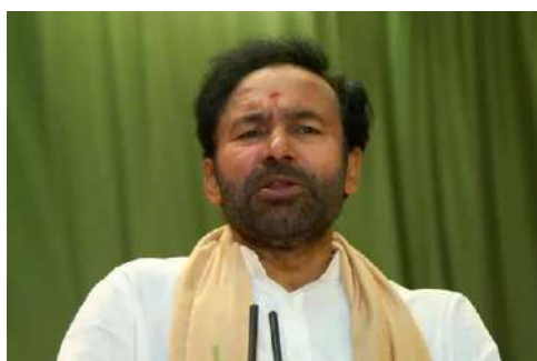
అందించేలా ఆయుష్మాన్ భారత్ పథకాన్ని అమల్లోకి తెచ్చారు. సనత్ సగర్ లోని ఈఎస్ఐసీ, బీబీసగర్ లోని ఎయిమ్స్ ను అన్ని విధాలుగా అభివృద్ధి చేయడం

అమీర్పేట: బీబీసగర్లో నిర్మిస్తున్న ఎయిమ్స్ అనువంతు వచ్చే ఏడాది ఫిబ్రవరి- మార్చి నాటికి ప్రధాని సరోవర మోడి చేతుల మీదుగా ప్రజలకు అందుబాటులోకి తీసుకువస్తామని కేంద్ర మంత్రి జి.కిషన్ రెడ్డి వెల్లడించారు.